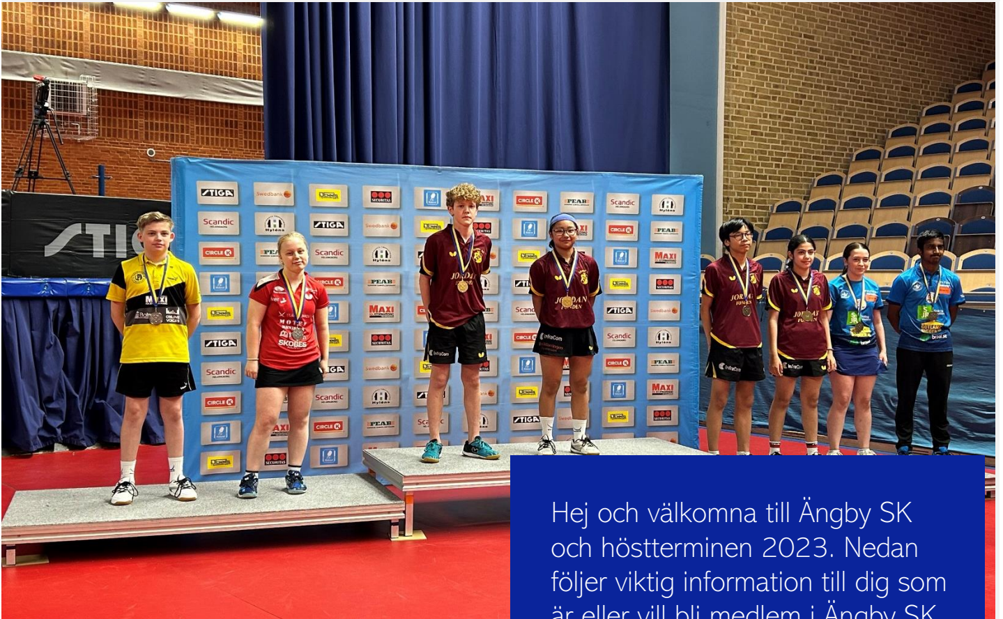
Ungdoms-SM 2023 prispallen Mixdubbel 14

Hej och välkomna till Ängby SK och höstterminen 2023. Nedan följer viktig information till dig som är eller vill bli medlem i Ängby SK (och till din målsman/dina föräldrar)