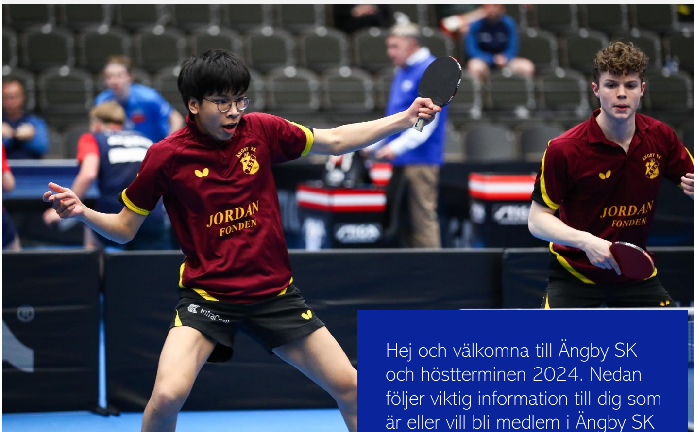
Ungdoms-SM 2024, Guld Pojkdubbel 16

Hej och välkomna till Ängby SK och höstterminen 2024. Nedan följer viktig information till dig som är eller vill bli medlem i Ängby SK (och till din målsman/dina föräldrar)